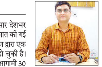
■ पैनल अधिवक्ताओं, मध्यस्थों और कानून के विद्यार्थियों को भी इस अभियान से जोड़ा गया है