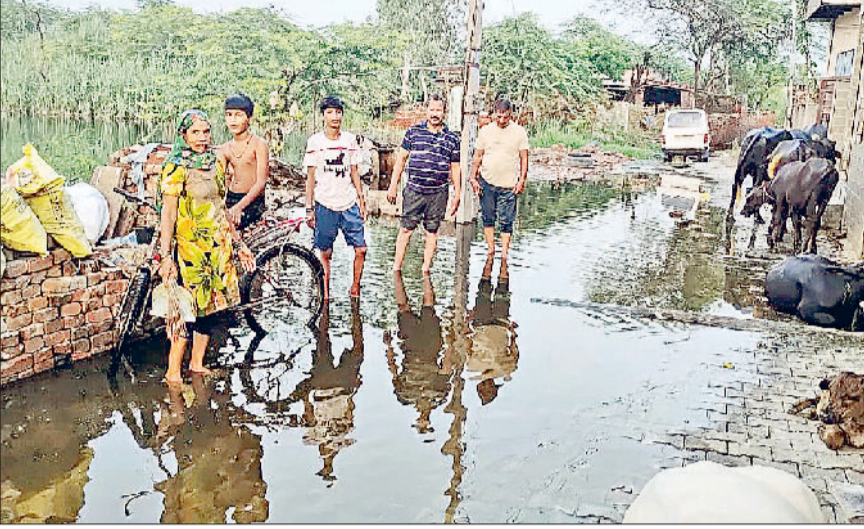
झज्जर। बिरधाना गांव में जलभराव के बीच खड़े ग्रामीण।