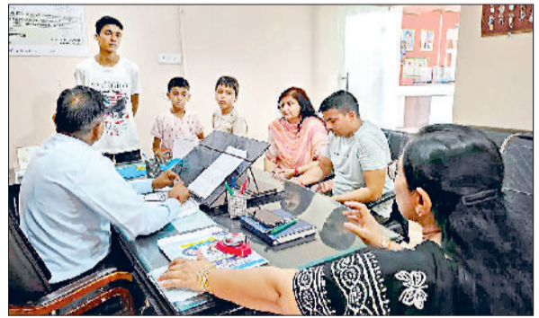
झज्जर। अभिभावक और अध्यापक बच्चों के समग्र विकास पर चर्चा करते हुए।