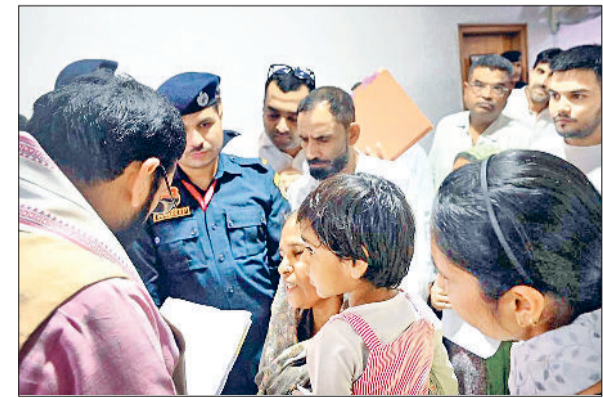
बहादुरगढ़। सीएम नायब सैनी को शिकायत सौंपते पीड़ित दुकानदार।

परिषद ने एक दुकानदार के नाम करवा दिया। जबकि सीएम कार्यालय ने इस सीडी पर दोनों पक्षों