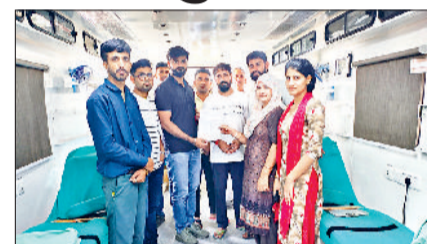
झज्जर। रक्तदाता को प्रशस्ति पत्र देकर सम्मानित करते हुए संस्था पदाधिकारी एवं सदस्य।

महान स्वतंत्रता सेनानी खुदिराम बोस की पुण्यतिथि की पूर्व संध्या पर अटल सेवा केंद्र दूबलधन, स्वामी विवेकानंद लाइब्रेरी, बाबा टूटा कमेटी, ग्राम पंचायत दूबलधन