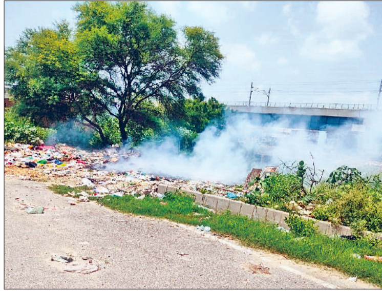
बहादुरगढ़। सेक्टर-9 मोड़ पर सड़क किनारे जलते कचरे से उठता धुआं।