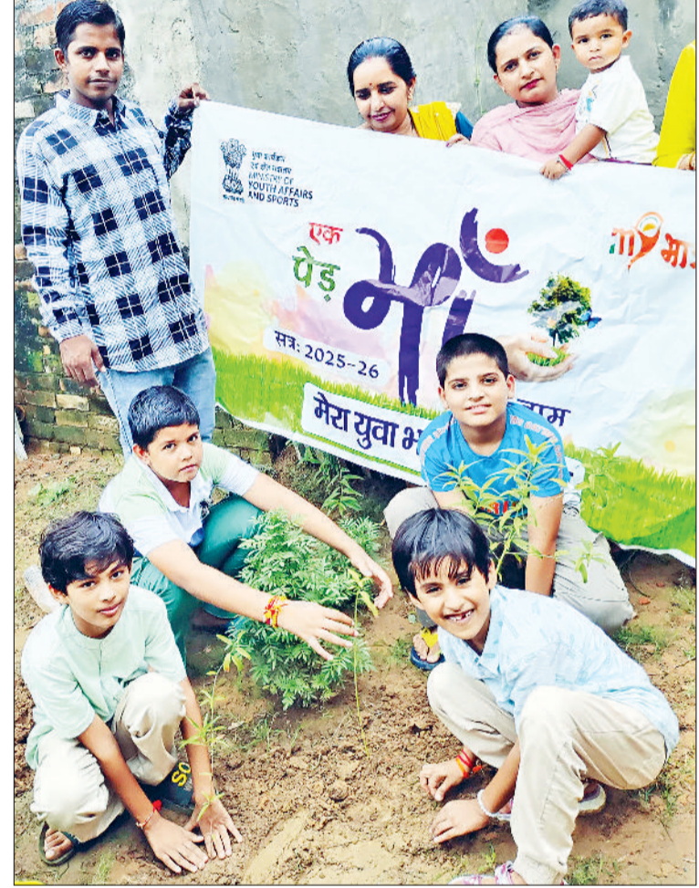
बहादुरगढ़। गांव खरहर में पौधे लगाती महिलाएं व बच्चे।

तैयार किए जा रहे हैं। मच्छरदानी के कपड़े की क्वालिटी में अंतर के कारण कई बार लोग अपनी पसंद की जाली खरीद कर साइज तैयार करवा रहे हैं। दुकानदारों की माने तो उनके पास दर्जनों पशुओं के लिए एक ही मच्छरदानी बनवाने के लिए लोग आ रहे हैं ऐसे में बड़े-बड़े साइजों में ग्राहकों के आर्डर पर मच्छरदानी तैयार की जा रही है। जानकारों का कहना है कि नीम व तुलसी के पत्तों की धूनी भी मच्छर भगाने में कारगर सिद्ध होती है। नीम व तुलसी के पत्तों को कुछ देर के लिए जलाने के बाद बुझा कर यदि एक कोने में रख दिया जाए तो उससे उठने वाला धुआं मच्छरों को दूर भगाने में सहायक रहेगा जिससे पशुओं को भी आराम मिलता है।