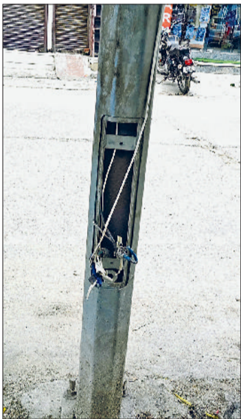
बहादुरगढ़। पुराने नजफगढ़ रोड पर खंभे से बाहर लटक रहे बिजली के तार।

लोगों ने बताया कि कई जगह बिजली के बॉक्सों को बंद करने के दरवाजे ही टूटे पड़े हैं।